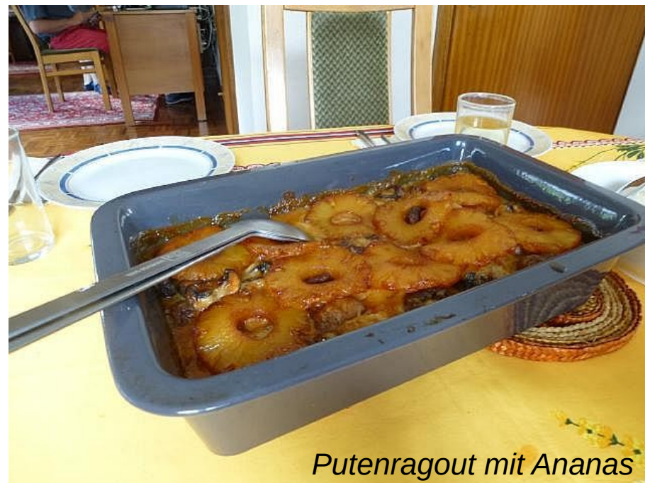
Putenragout mit Ananas